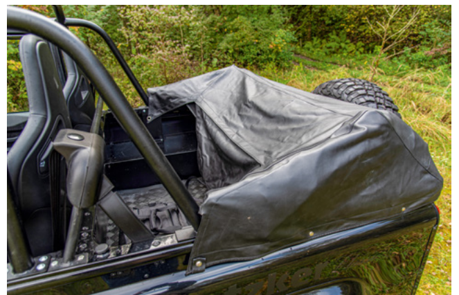
Der NAS-Käfig für das Cabrio ist eine Sonderanfertigung. Der Umbau auf ein Kilzer-Verdeck ist auch heute noch möglich.