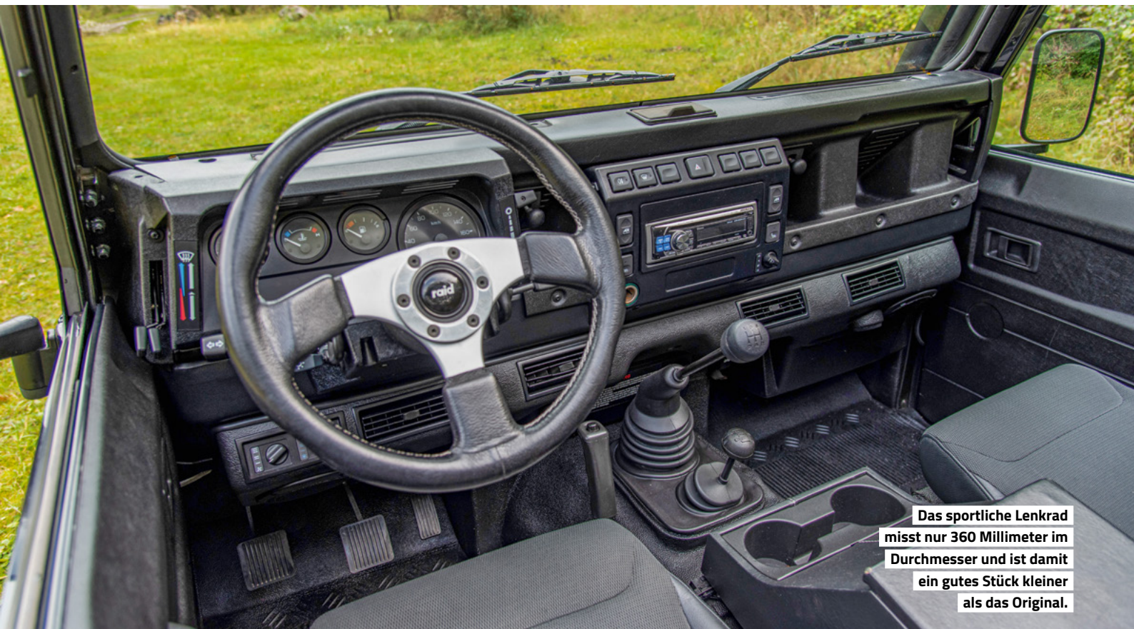
Das sportliche Lenkrad misst nur 360 Millimeter im Durchmesser und ist damit ein gutes Stück kleiner als das Original.