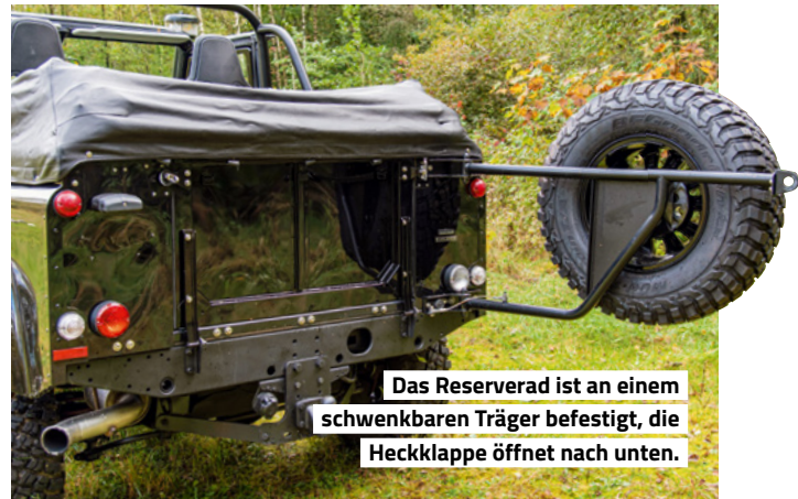
Das Reserverad ist an einem schwenkbaren Träger befestigt, die Heckklappe öffnet nach unten.