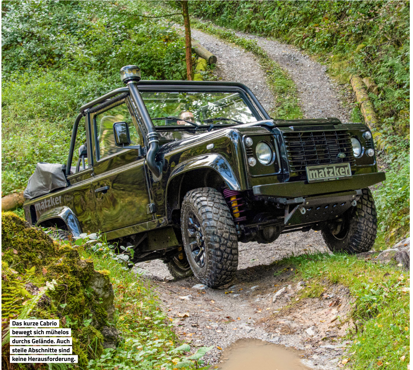
Das kurze Cabrio bewegt sich mühelos durchs Gelände. Auch steile Abschnitte sind keine Herausforderung.