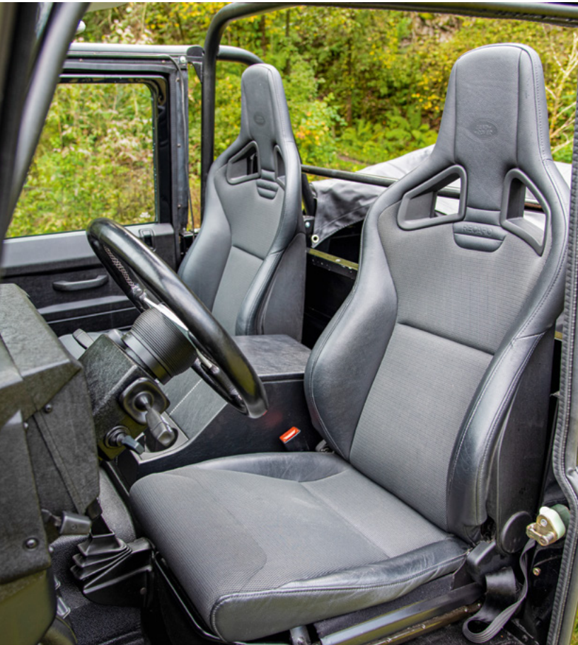
Dank Sitzschienenverlängerung finden die Beine ausreichend Platz. Dennoch bleibt es auf den Vordersitzen Defender-typisch beengt.