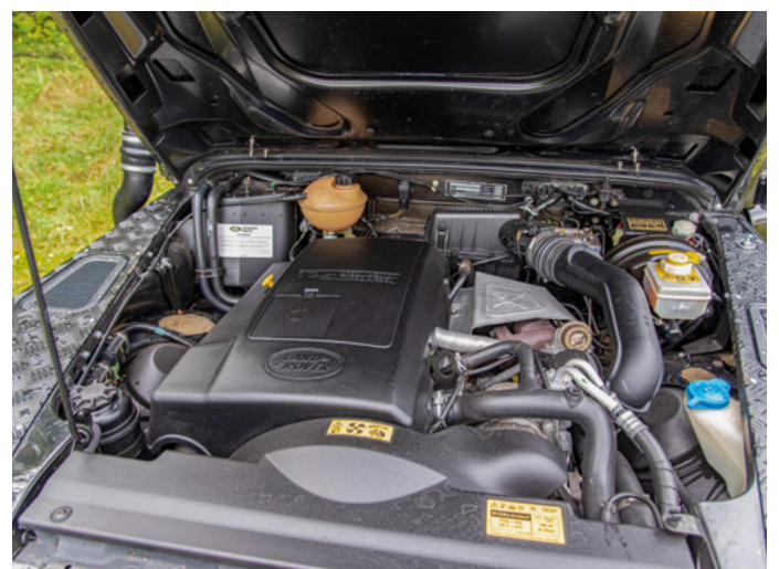
Die goldfarbene Matzker-Classic-Cars-Plakette (rechts oben) darf nicht jeder Umbau tragen. Sie steht für Qualität und Originalität.