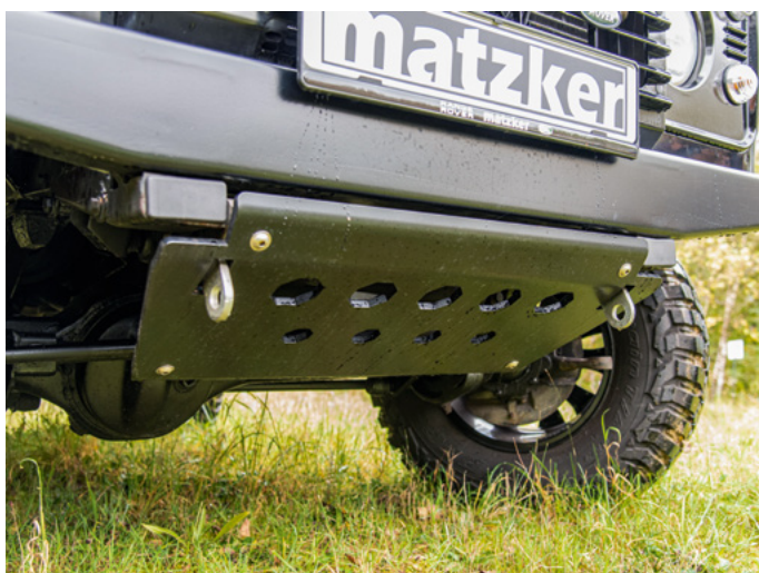
Der Unterfahrschutz passt farblich und schützt den Matzker-Umbau vor Beschädigungen im Gelände.